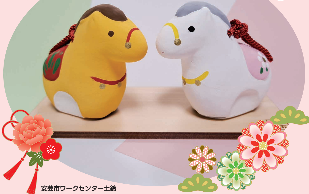
安芸市ワークセンター土鈴